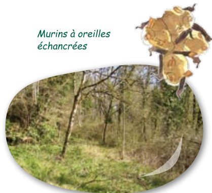
Murins à oreilles échancrées