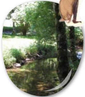
Murin de daubenton